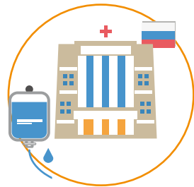
Госпитализация и лечение