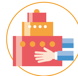
Выездная реабилитационная программа. День рождения Фонда