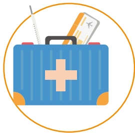
Патронаж и медицинское сопровождение